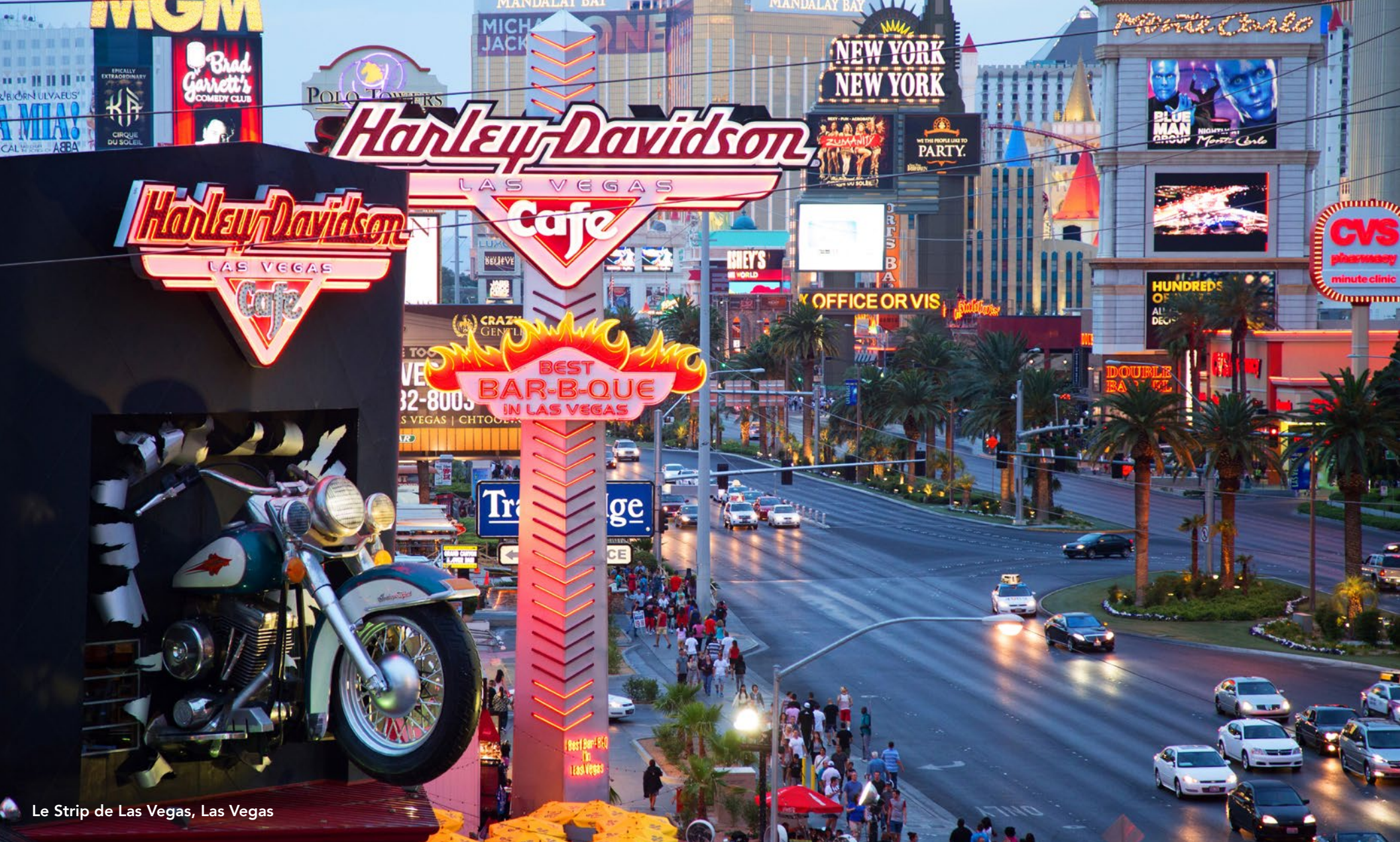
Le Strip de Las Vegas, Las Vegas