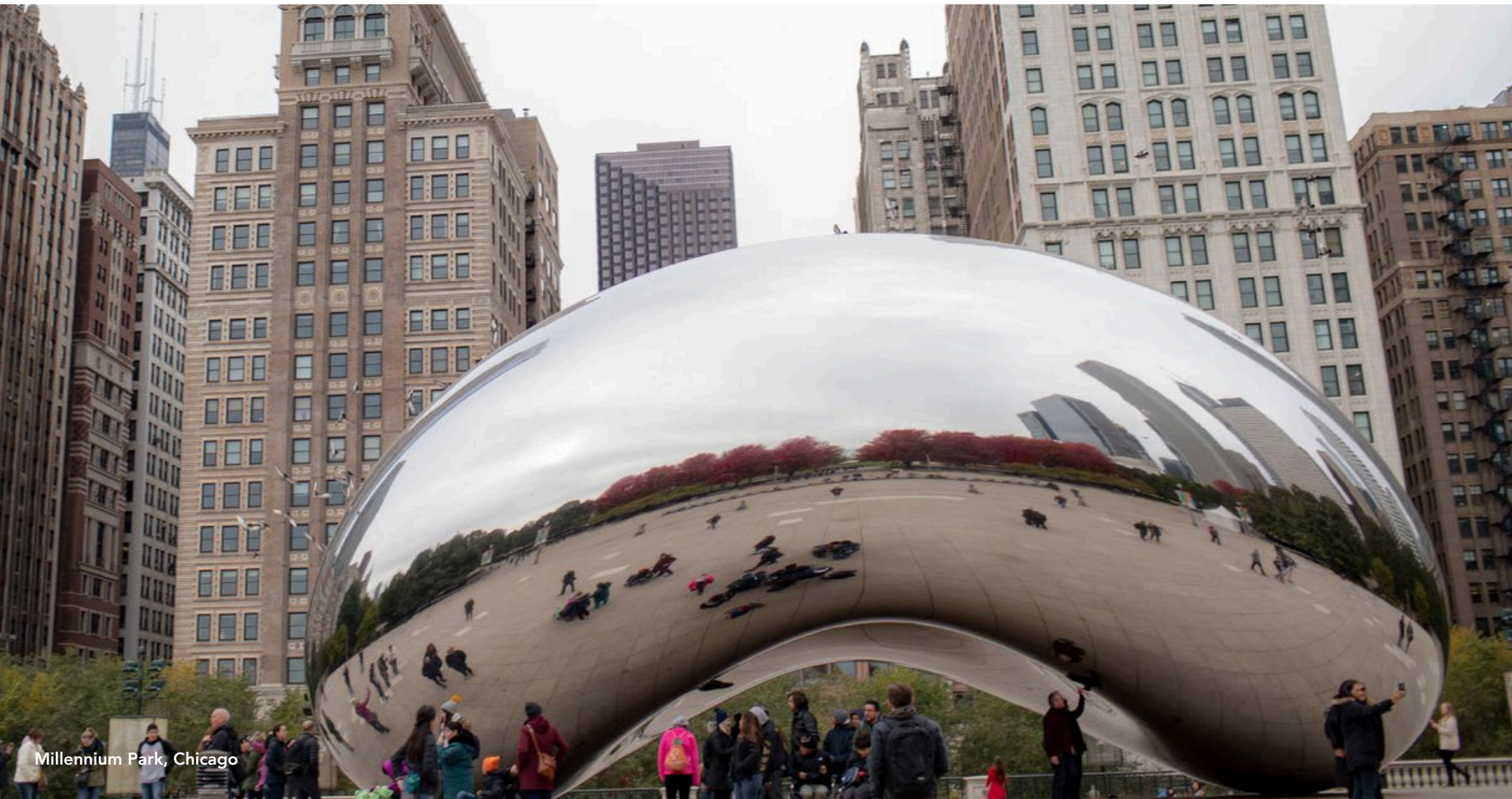
Millennium Park, Chicago