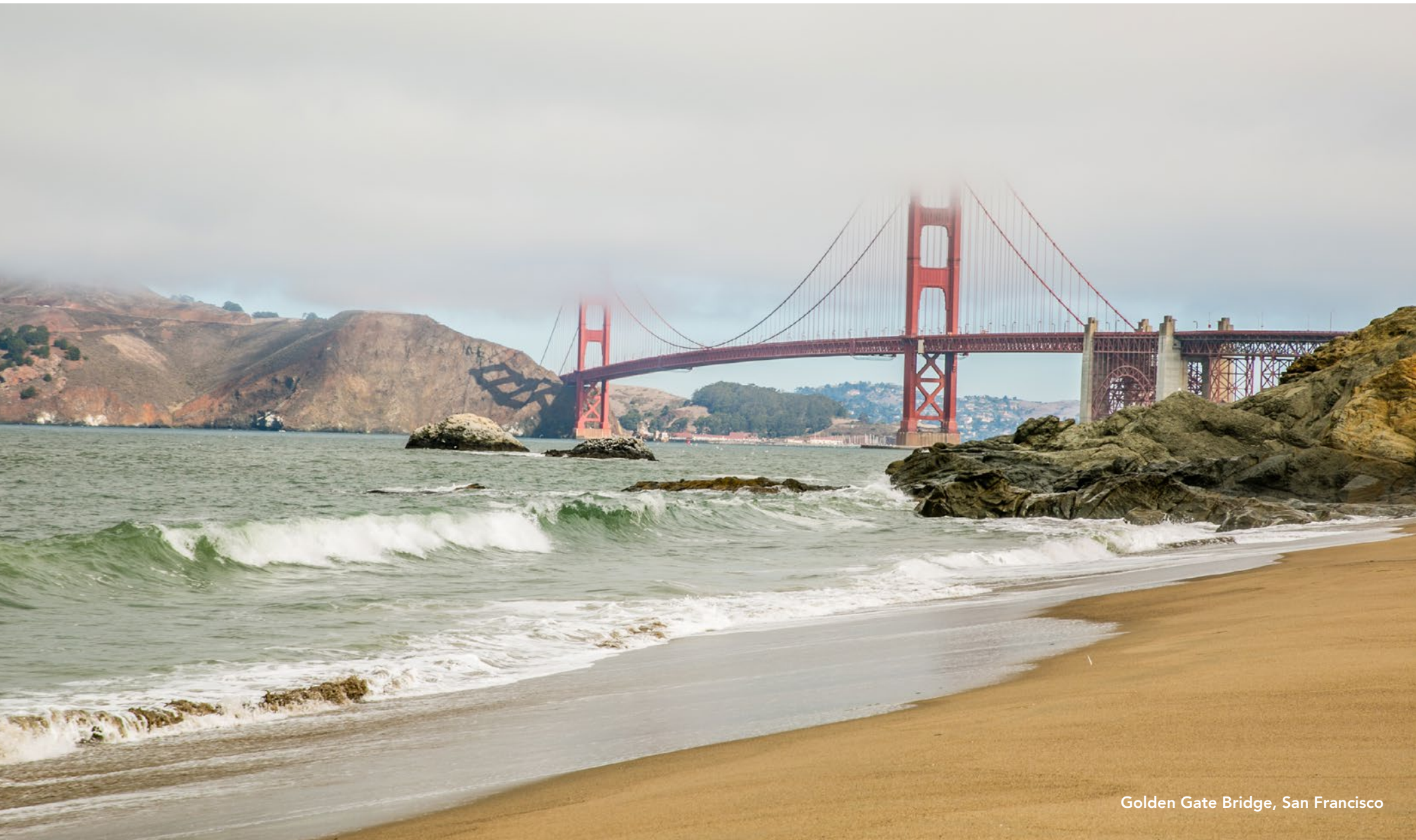
Golden Gate Bridge, San Francisco