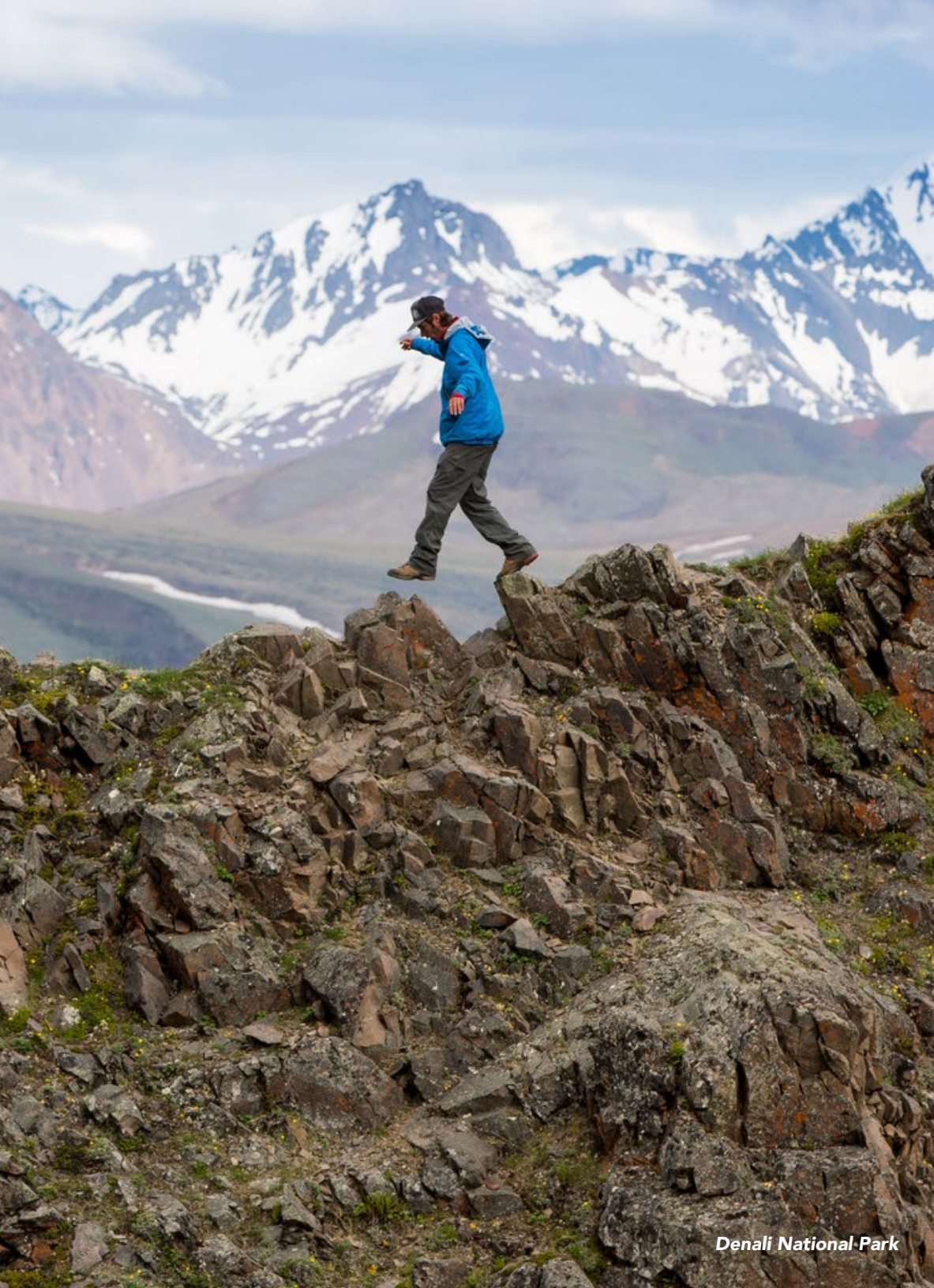
Denali National Park