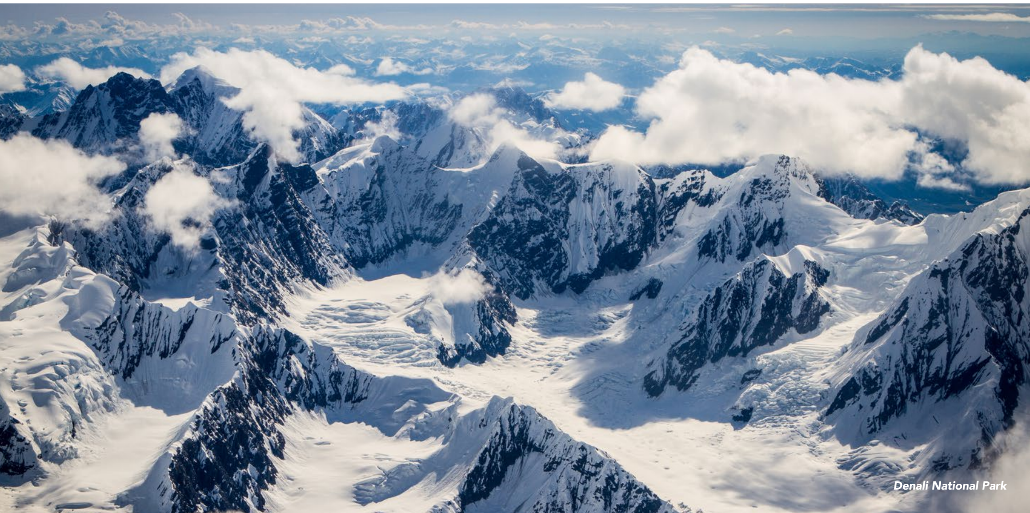
Denali National Park

Pour obtenir d'autres idées de circuits et de voyages aux États-Unis, consultez le site: VisitTheUSA.com