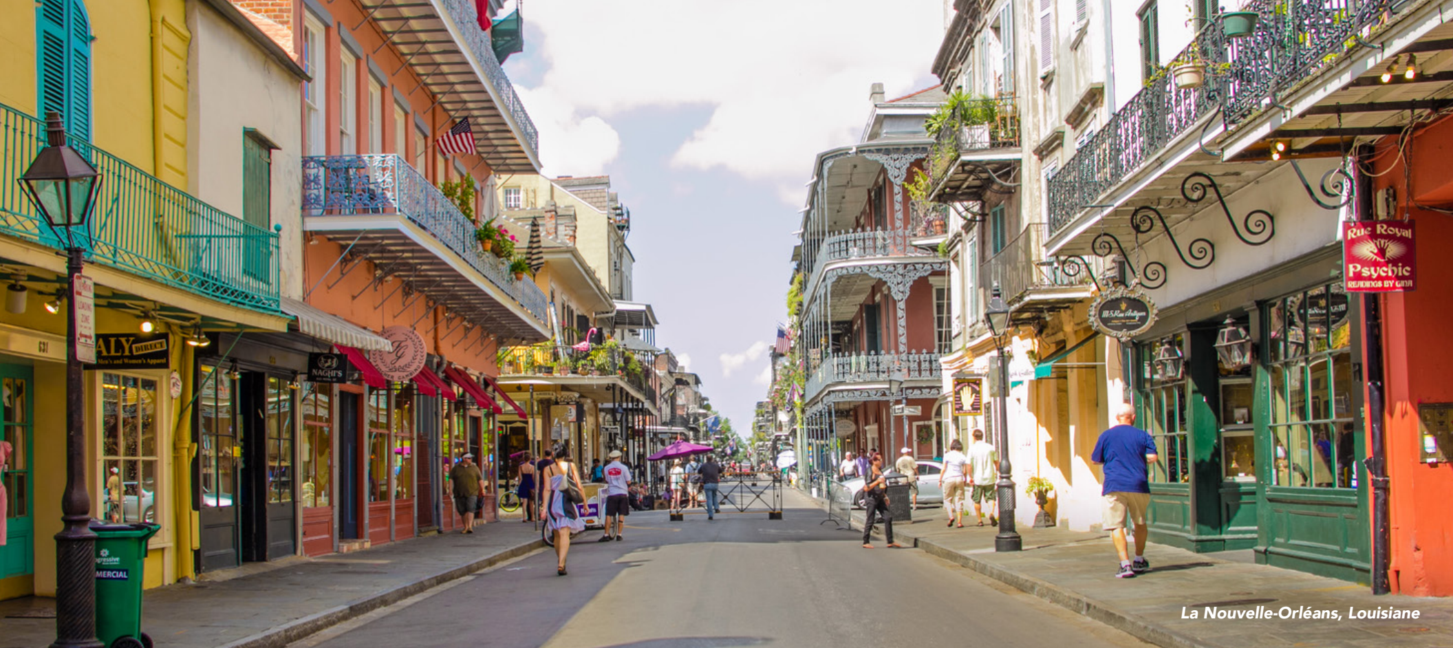
La Nouvelle-Orléans, Louisiane