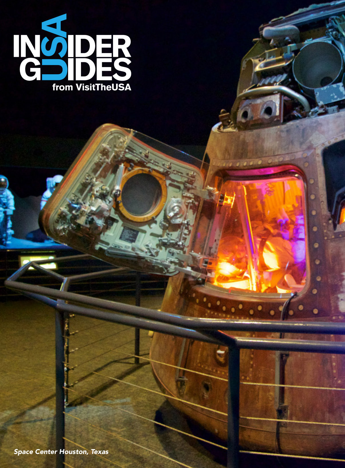
Space Center Houston, Texas