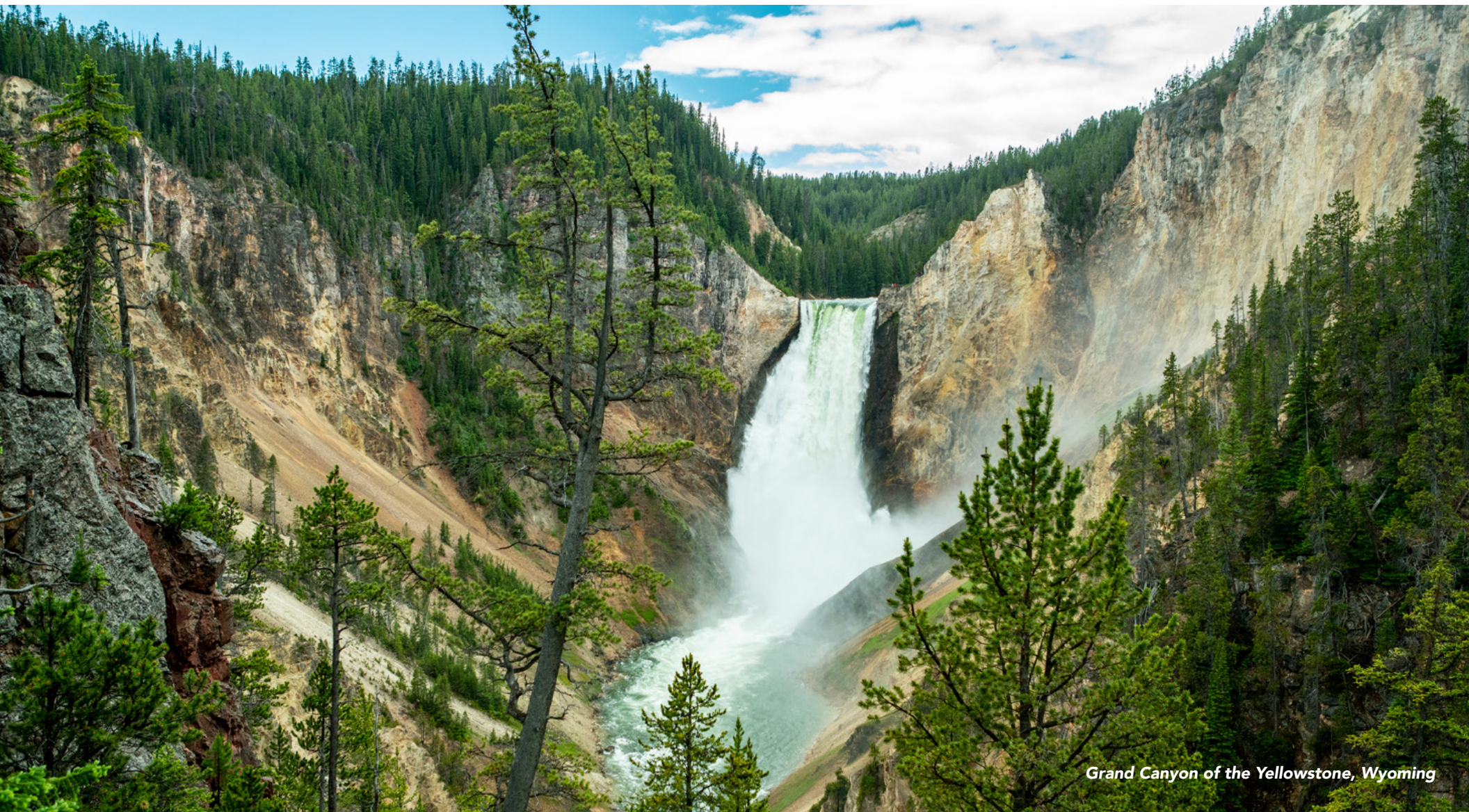
Grand Canyon of the Yellowstone, Wyoming